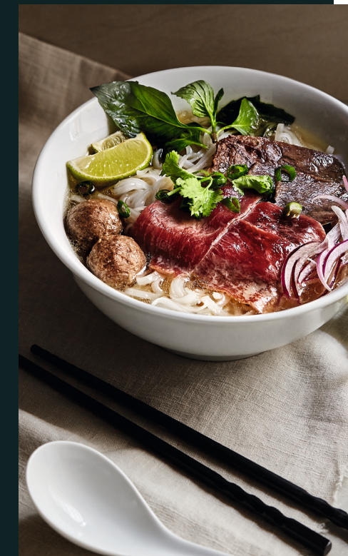
91 PHỞ SÀI GÒN

101) PHỞ VEGGIE | 12,50 Saisonales Gemüse, Hühnerbrühe