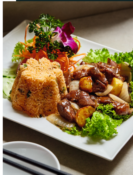
64 BÒ LỨC LẮC