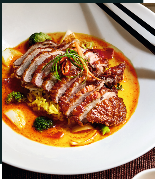
40 RED CURRY CRISPY DUCK