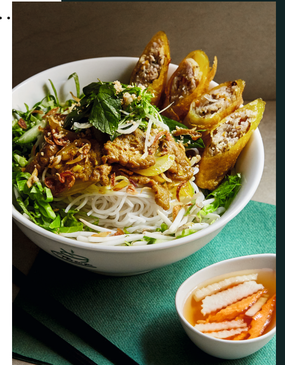
105 BÚN CHẢ GIÒ BEEF