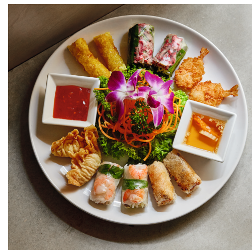
V2 STARTERS MIX

29) BÁNH BÈO | 5,70 Gedämpfte Reisflade, grüne Bohnen, getrocknete Shrimps