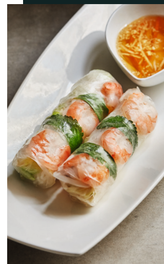
30 GỎI CUỐN SHRIMPS