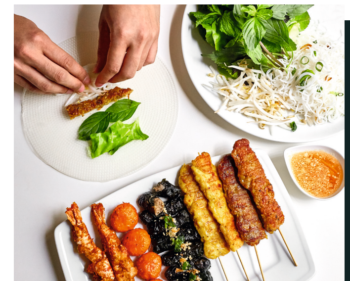
116 SKEWERS MIX PLATE