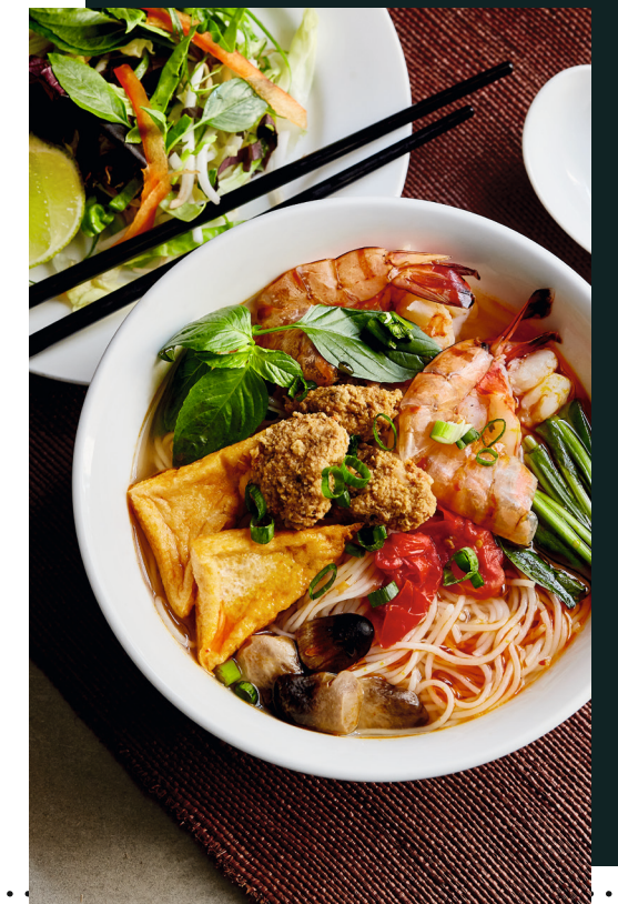
96 BÚN CRAB SOUP

100) BÚN SWEET & SOUR PRAWNS | 16,50 Okra, Tigergarnelen, Tomatenwürfel, Galadium, Koriander, Sojasprossen