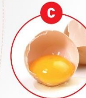
C EIER VON GEFLÜGEL UND DARAUS GEWONNENE ERZEUGNISSE

z.B. Feinkostsalate, Suppen, Soßen, Paella, Bouillabaisse, Sushi, Surimi