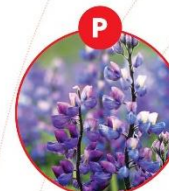
P LUPINEN UND DARAUS GEWONNENE ERZEUGNISSE

z.B. Fruchtzubereitungen, Müll, Brot, Fleischerezeugnisse, Feinkostsalate, Suppen, Soßen, Sauerkraut, Fruchtsaft, Chips und andere getrocknete Kartoffelerzeugnisse, gesalzener Trockensack