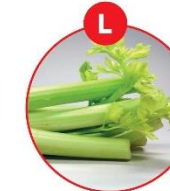
L SELLERIE UND DARAUS GEWONNENE ERZEUGNISSE

z.B. Brot, Kuchen, Gebäck, Brühwürste (Plätzchen), Rohwürste (Marinade), Pasteten, Feinkostsalate (Wolort), Joghurt, Käse, Nuss / Nougatcreme, Aufstriche, Müll, Schokolade, Margarine, Müll, Kakaos, Dressings, Curry, Pesto, Desserts, Liquor, aromatisierter Kaffee