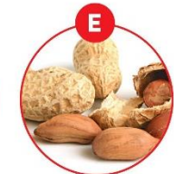
E ERDNÜSSE UND DARAUS GEWONNENE ERZEUGNISSE

z.B. Kräcker, Soßen, Suppen, Würstchen, Würste, Surimi, Sardellenwurst, Bräutungskuchen, Feinkostsalate, Pasteten, Weinstronato