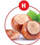
H SCHALENFRÜCHTE UND DARAUS GEWONNENE ERZEUGNISSE

z.B. Brot, Kuchen, Gebäck, Brüh-, Koch-, Röh-, Bräutungskuchen, Margarine, Nussaugencreme, Müll, Schokolade, Karamell, Aufgüsse, Gratin, Kartoffelgürne, Kravetten, Pommes, Frites, Chips, Suppen, Soßen, Dressing, Marinaden, Desserts, Kakao, Wein