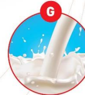
G MILCH VON SÄUGETIEREN UND MILCHERZEUGNISSE (INKLUSIVE LAKTOSE)

z.B. Brot, Kuchen, Gebäck, Feinkostsalate, Margarine, Schokolade, Brotbackmittel, Müll, Schokolade, Kakaos, Kaugummi, Soßen, Dressings, Marinaden, Mayonaisse, Eis, Sportlernahrung, Saftdrinks, Kaffeevollkorn