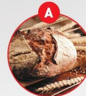
A GLUTENHALTIGES GETREIDE UND DARAUS GEWONNENE ERZEUGNISSE

z.B. Brot und Gebäck, Kuchen, Teigwaren, Suppen, Soßen, Paniermehl, Semmelbrösel, Wurstwaren, Backwaren, Früchtkornbrot, Desserts, Schokolade