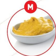
M SENF UND DARAUS GEWONNENE ERZEUGNISSE

z.B. Suppengrün, Gewürzrot, Wurst, Fleischerezeugnisse, Feinkostsalate, Joghurt, Käse, Flüssiggewürze, Feinkostsalate, Brühe, Suppen, Zimol, Marinaden, Gewürzcremen, Curry, salzige Snacks (Chips)