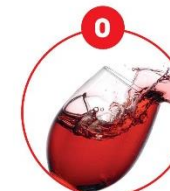
O SCHWEFELDIOXID UND SULFITE

z.B. Brot, Knechtelrot, Gebäck, Aufgüsse und salzig, Müll, vegetarische Gemüse, Fajol, Salate, Humus, Feinkostsalate, Marinaden, Desserts