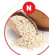
N SESAMSAMEN UND DARAUS GEWONNENE ERZEUGNISSE

z.B. Fleischerezeugnisse, Feinkostsalate, Suppen, Soßen, Dressing, Mayonaisse, Ketchup, emulgiertes Gemüse und Gewürzcremen, Käse, Essiggurken