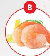
B KREBSTIERE UND DARAUS GEWONNENE ERZEUGNISSE

z.B. Brot und Gebäck, Kuchen, Teigwaren, Suppen, Soßen, Paniermehl, Semmelbrösel, Wurstwaren, Backwaren, Früchtkornbrot, Desserts, Schokolade