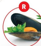
R WEICHTIERE WIE SCHNECKEN, MUSCHELN, TINTENFISCHE UND DARAUS GEWONNENE ERZEUGNISSE

z.B. Brot, Gebäck, Pasta, Nudeln, Snacks, fettreduzierte Fleischerezeugnisse, Fleischsalat/ vegetarische Produkte, glutenfreie Produkte, Desserts, mit Hefe Zierersatz, Kaffeeersatz, Flüssiggewürze