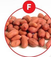
F SOJABOHNEN UND DARAUS GEWONNENE ERZEUGNISSE

z.B. Margarine, Brot, Kuchen, Gebäck, Schokolade, Biscuits/Plätzchen, Cerealien, Müll, Frühstückskuchen, Schokolade, Feinkostsalate, Marmelade, Salzsaft, Eis, aromatisierter Kaffee, Liquor, Pommes Frites