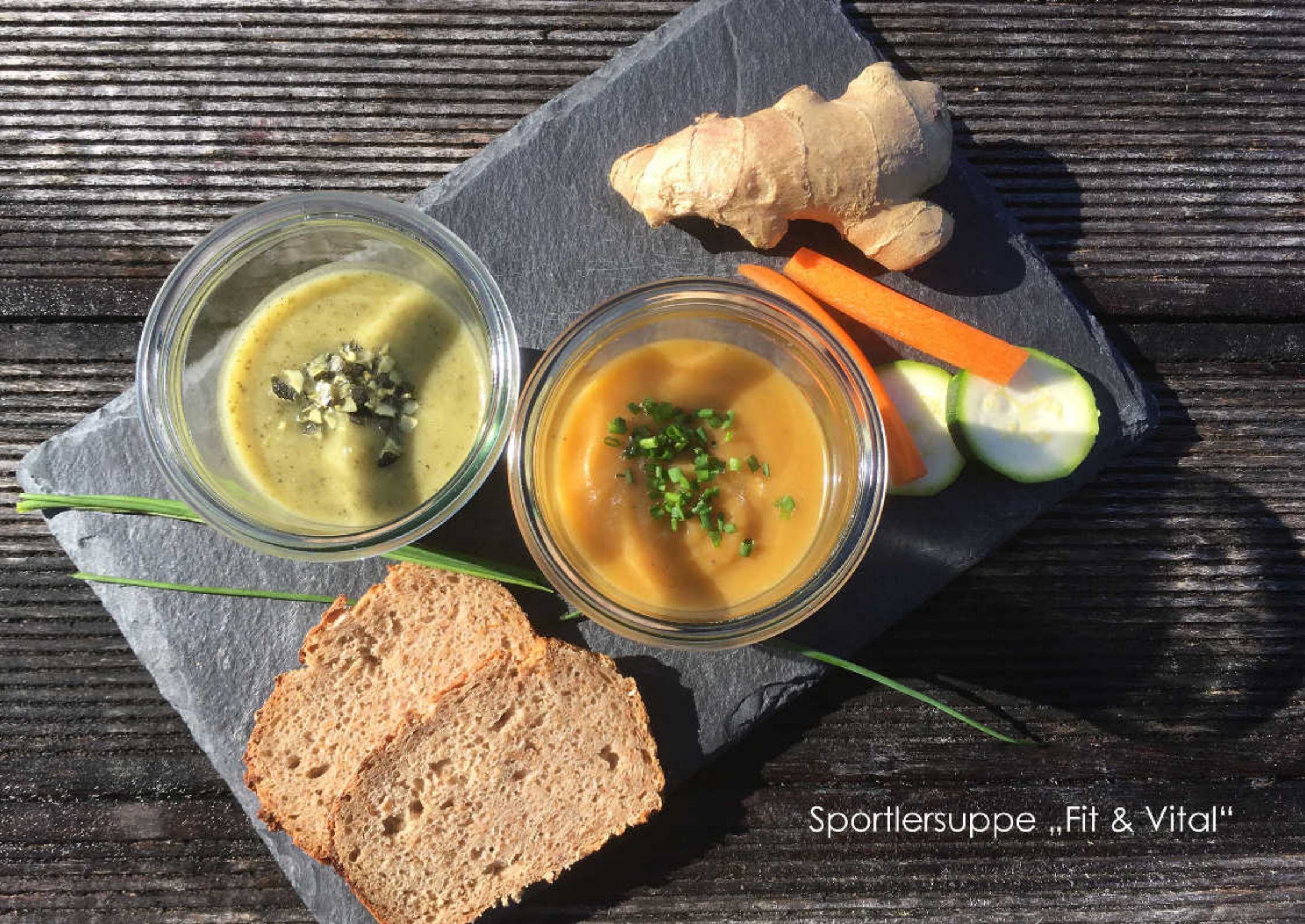
Sportlersuppe „Fit & Vital“