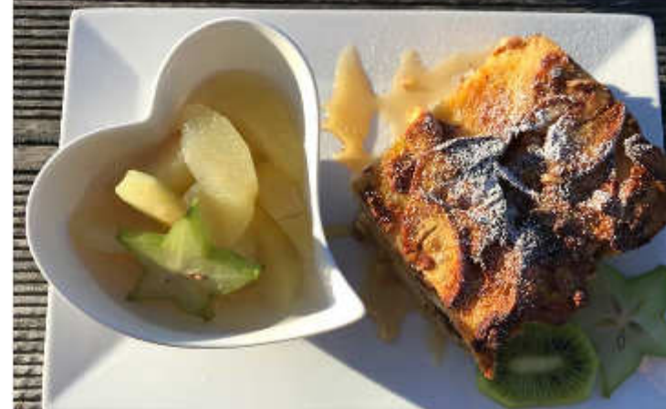
Süßer Auflauf „Scheiterhaufen“