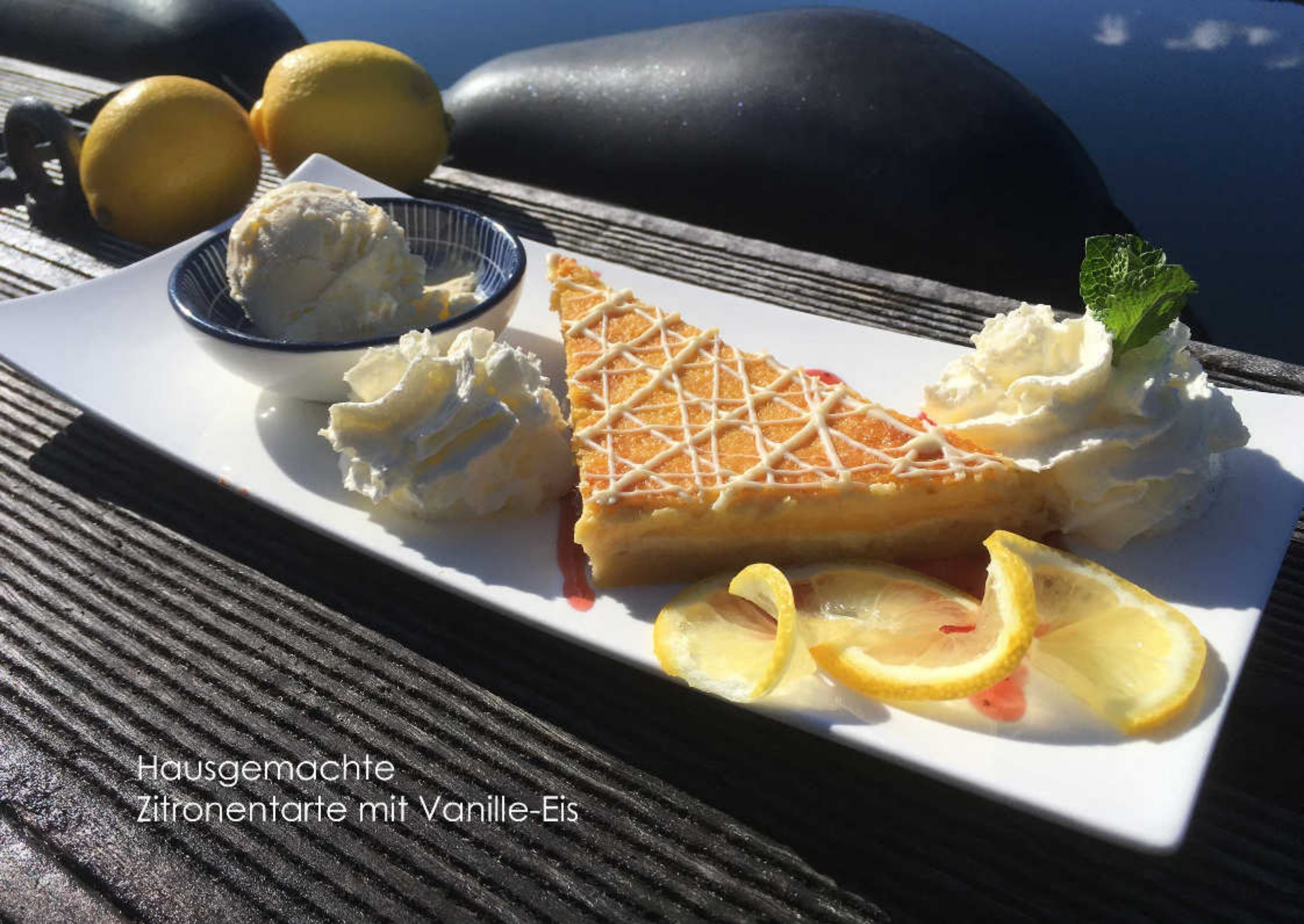
Hausgemachte Zitronentarte mit Vanille-Eis