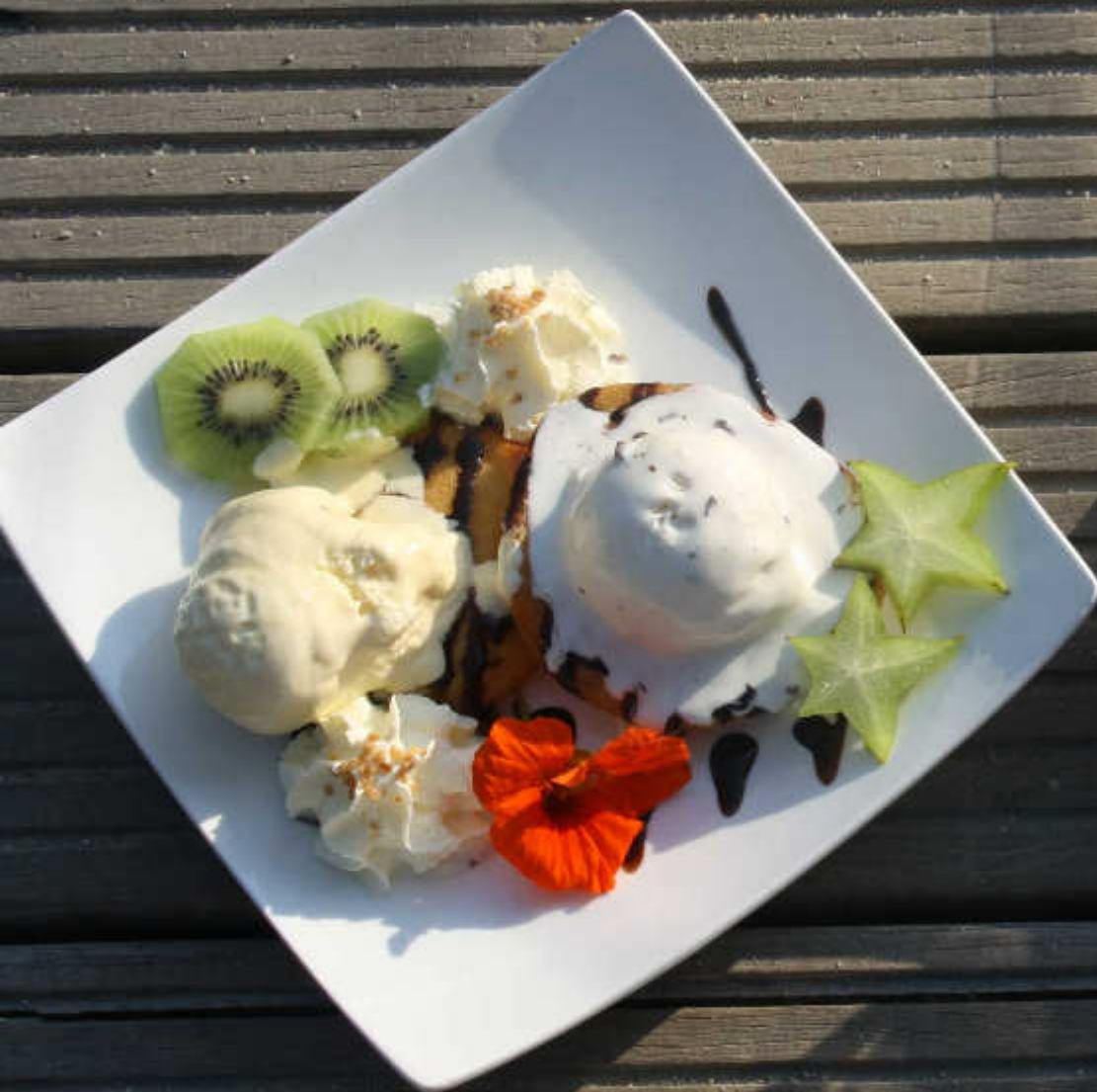
Pancakes mit Vanille- und Stracciatella-Eis