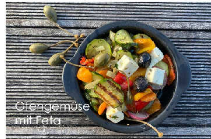
Ofengemüse mit Feta

Hausgemachter kühlender Quinoa-Salat mit Zucchini, Zuckermelone und Feta Vegetable salad with quinoa, melon and feta cheese insalata con quinoa, zucchini, melone e formaggio feta