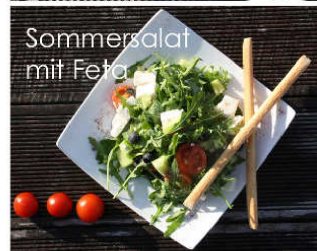
Sommersalat mit Feta