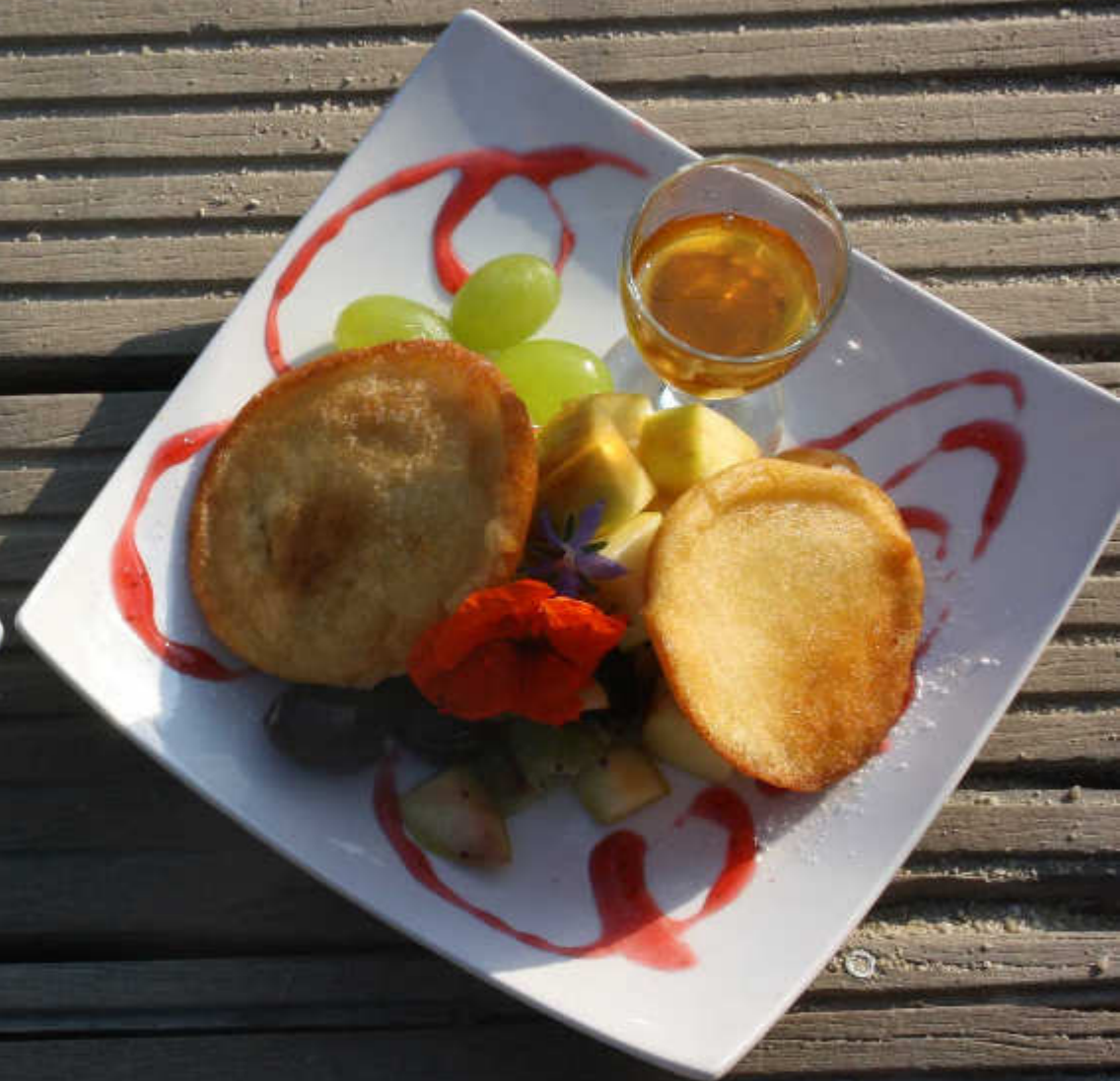
Pancakes mit frischen Früchten